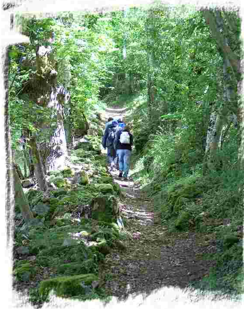
Forêt communale de Chénérailles

13. Au bout de l'étang tourner à droite pour rejoindre le village vacances.