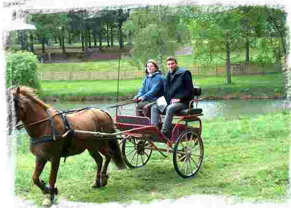
Étang de la Forêt de Chénérailles